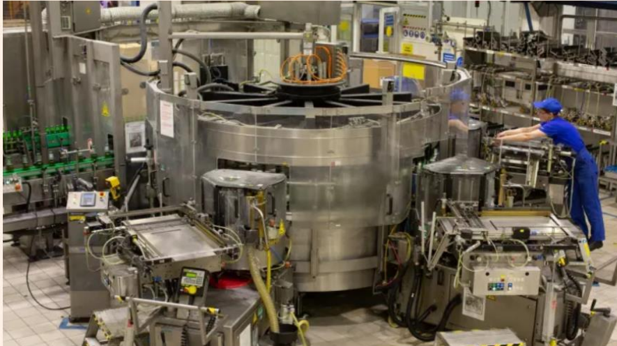
A worker checks an automated labelling machine at the Baltika Breweries plant in St Petersburg. Carlsberg first bought a stake in Baltika in 2000

Fear for western subsidiaries in Russia after Moscow hands food group to Chechen minister and Kovalchuks vie for Baltika