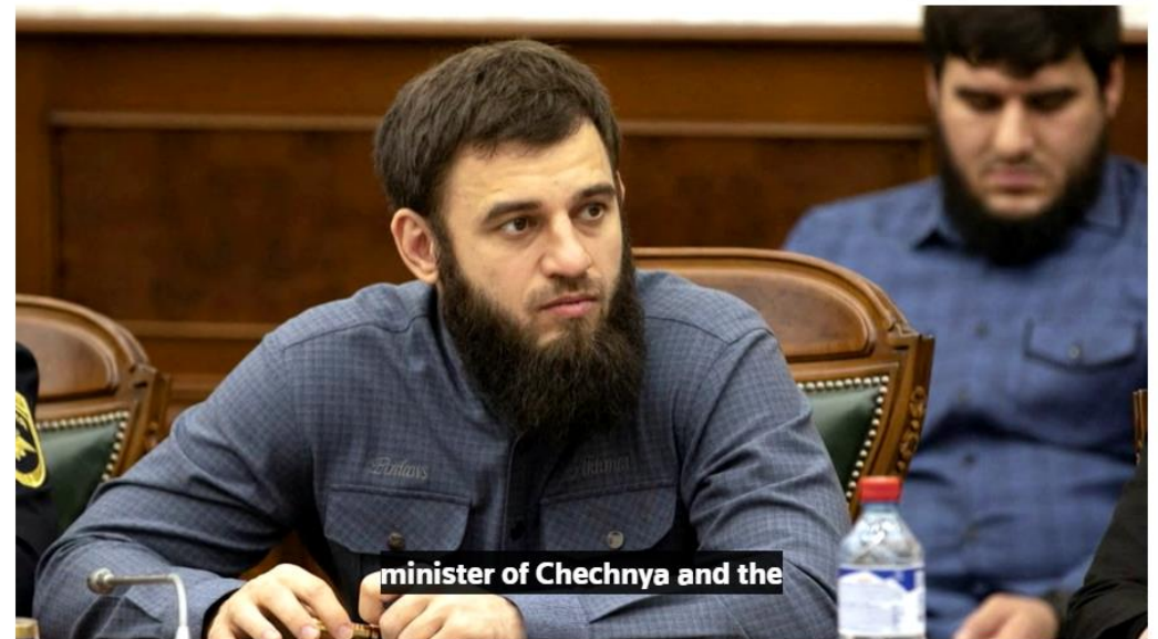
minister of Chechnya and the

https://www.reuters.com/business/retail-consumer/chechen-leaders-nephew-new-head-russias-danone-subsidiary-media-2023-07-19/